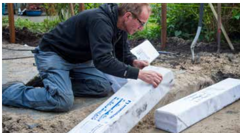
Plaats de blokken in de aangegeven positie