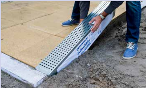
Hydroblob® blokken met roosters achter elkaar plaatsen