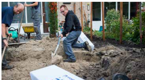
Benodigde diepte en breedte uitgraven