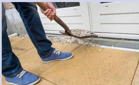
Of Hydroblob® blokken zonder rooster plaatsen en afwerken met grind.