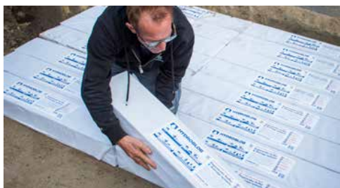
Plaats het gewenste aantal blokken afhankelijk van de oppervlakte en grondsoort