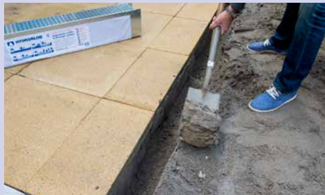
Benodigde diepte en breedte uitgraven