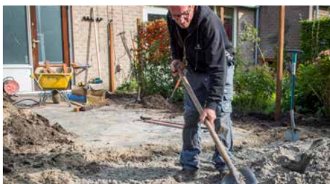
Vul op met een deklaag van zand, grind of grond. Klaar!